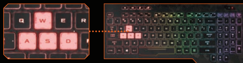
[ W/ASDキーをハイライト ]

キーボードには、ゲームにもビジネスにも使いやすい英語配列を採用。キーが光るので、暗い場所でも使用でき、光り方や光の色を変更して自分好みのキーボードにすることも可能です。繊細な操作に対応できるゲーム用の設計なので、文章の入力などに最適です。