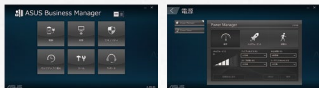
[ASUS Business Manager 設定画面]

ASUS Business Managerなら、よく使うアクションに簡単にアクセスが可能です。スピーディに電源管理や更新などさまざまな設定ができるので、仕事の効率も一段と向上します。