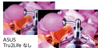
ASUS Tru2Life なし