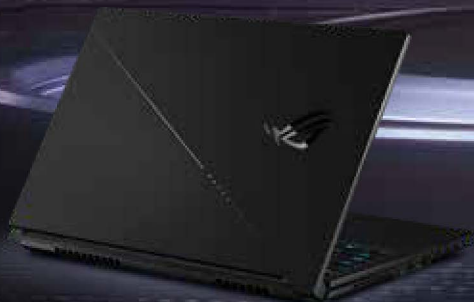
アール・オー・ジー ゼフィルス