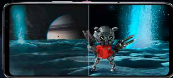
通常のディスプレイ