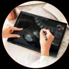
4096レベルの筆圧検知対応 ASUS PEN 付属

タッチにもスタイラス入力にも対応。ASUS Penで、まるで本物のキャンパスの上に描くような感覚で、あなたの描きたいものが思いのままに表現できます。