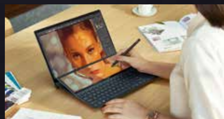
ASUS Pen (別売) での入力もスムーズに

タッチ・スタイラス入力にも対応の12.6型液晶は、セカンドディスプレイとしてはもちろん、専用の内蔵アプリにより、画面間の移動やショートカットの表示などが簡単に行え、スムーズなマルチタスクを可能にします。また、本体を開くと約7°の傾斜がつき、反射や映り込みを軽減し、高い視認性を確保する最適な角度を維持します。