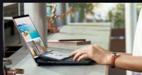
データを参照しながらの資料作成に