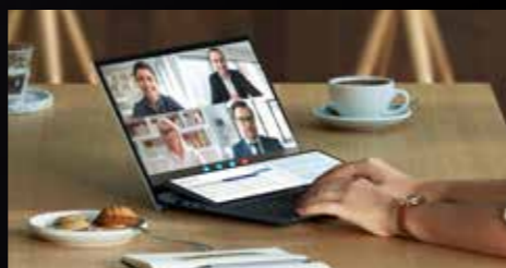
Web会議をしながらの作業に