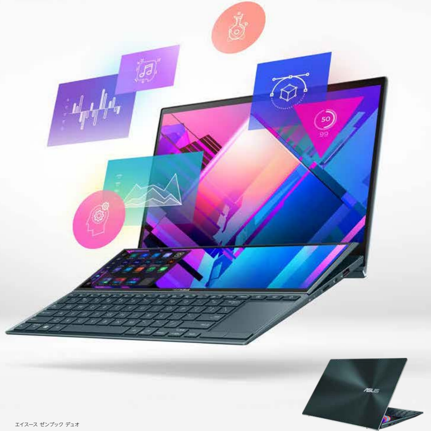
EISUS ZENBUCK DUO